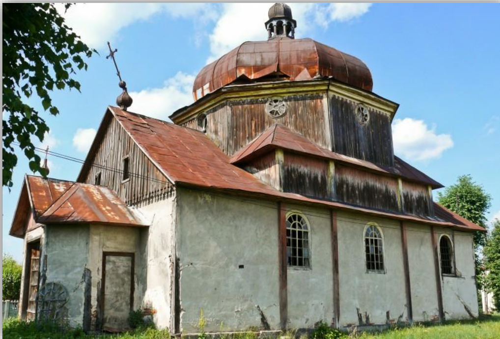
Rysunek 5 Cerkiew w Wielkich Oczach

Cennym zabytkiem jest XVII-wieczny dwór obronny wzniesiony w kształcie litery „H” i otoczony resztkami bastionowych fortyfikacji ziemnych w stylu staroholenderskim. Po zaprzestaniu pełnienia funkcji mieszkalnych przeznaczony został na cele przemysłowe (gorzelnia, młyn). Odrestaurowany w latach 1973-1978 stał się siedzibą Urzędu Gminy.