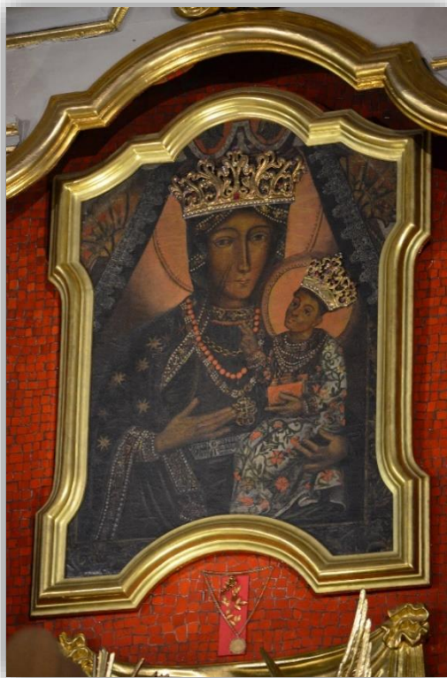
Rysunek 2 Obraz MB Pocieszycielki Strapionych

W pobliżu kościoła wznosi się klasztor SS. Boromeuszek zbudowany w latach 1890-1893. W II poł. XX w. remontowany, modernizowany i rozbudowany. Mieści się w nim Dom Pomocy Społecznej dla dzieci i młodzieży niepełnosprawnych intelektualnie.