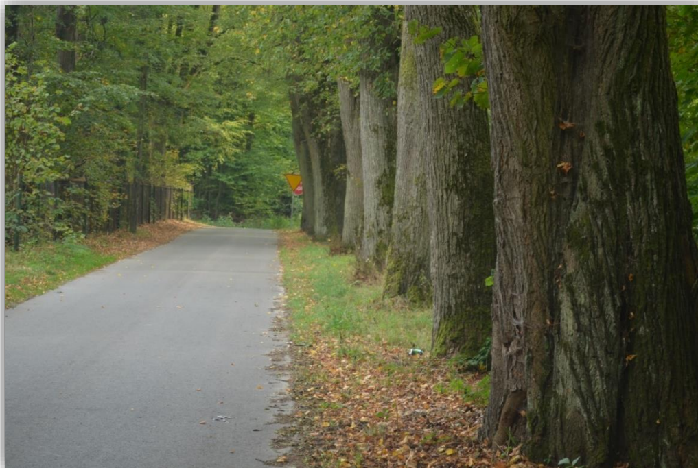
Rysunek 7 Pozostałości alei grabowej w Wielkich Oczach

W Wielkich Oczach przy ul. Leśnej zobaczyć też można pozostałości po parku , w którym mieścił się nieistniejący już, murowany dworek z XIX w. oraz domy dla służby. Wzdłuż zewnętrznej osi parku i głównej drogi dojazdowej zachowały się nasadzenia z grabu i lipy.