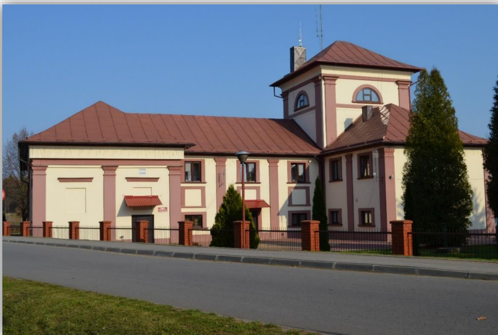
Rysunek 6 Dawny dwór obronny w Wielkich Oczach

Cennym zabytkiem jest XVII-wieczny dwór obronny wzniesiony w kształcie litery „H” i otoczony resztkami bastionowych fortyfikacji ziemnych w stylu staroholenderskim. Po zaprzestaniu pełnienia funkcji mieszkalnych przeznaczony został na cele przemysłowe (gorzelnia, młyn). Odrestaurowany w latach 1973-1978 stał się siedzibą Urzędu Gminy.