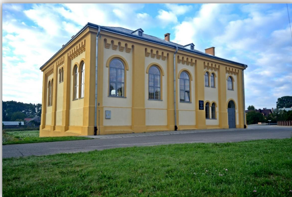
Rysunek 4 Synagoga w Wielkich Oczach. Obecnie siedziba Gminnej Biblioteki Publicznej

W sąsiedztwie rynku znajduje się murowana synagoga z 1910 r. zniszczona w czasie działań wojennych, odbudowana w 1927 roku, głównie dzięki pomocy Eliahu Gottfrieda, amerykańskiego Żyda, emigranta z Wielkich Oczu, co upamiętnia tablica z czarnego marmuru wmurowana w ścianę świątyni.