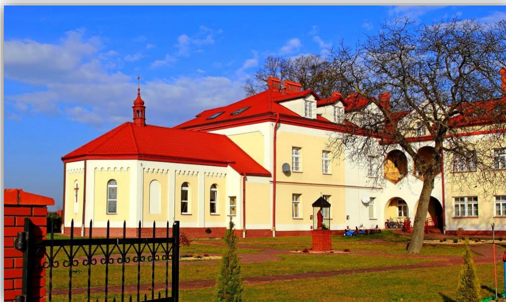
Rysunek 3 Klasztor SS. Boromeuszek w Wielkich Oczach

W pobliżu kościoła wznosi się klasztor SS. Boromeuszek zbudowany w latach 1890-1893. W II poł. XX w. remontowany, modernizowany i rozbudowany. Mieści się w nim Dom Pomocy Społecznej dla dzieci i młodzieży niepełnosprawnych intelektualnie.